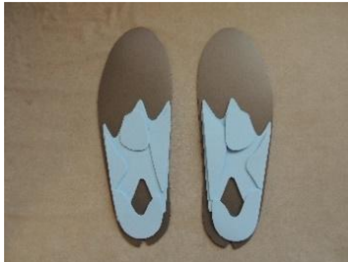
外反母趾インソール