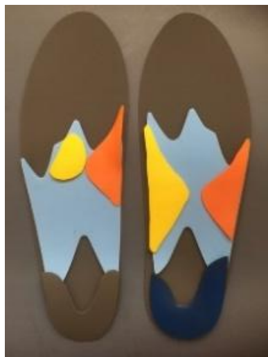
変形膝関節症インソール